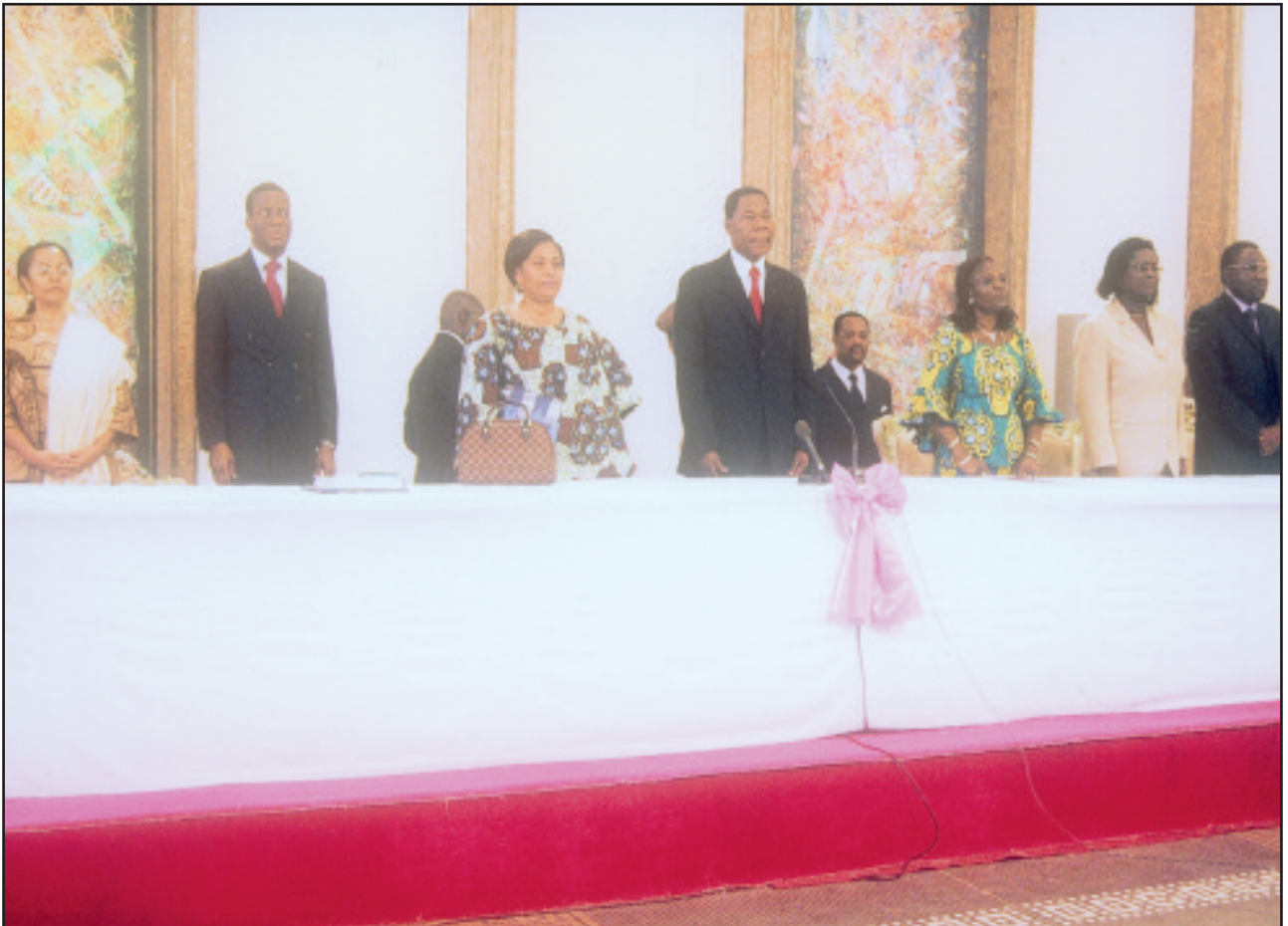
Le Chef de l'Etat entouré des Représentants Résidents de l'UNFPA et du PNUD, du Ministre d'Etat chargé de la Prospective, du Développement, de l'Evaluation des Politiques Publiques et de la Coordination de l'Action Gouvernementale, de la 1 ère Dame et du Ministre de la Famille et de la Solidarité Nationale le 09 mars 2009 lors de la célébration de la Journée Internationale de la Femme