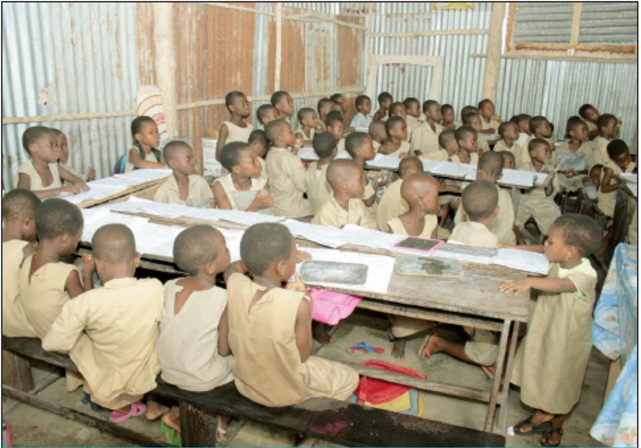
Vue d'écolières et d'écoliers dans une salle de classe