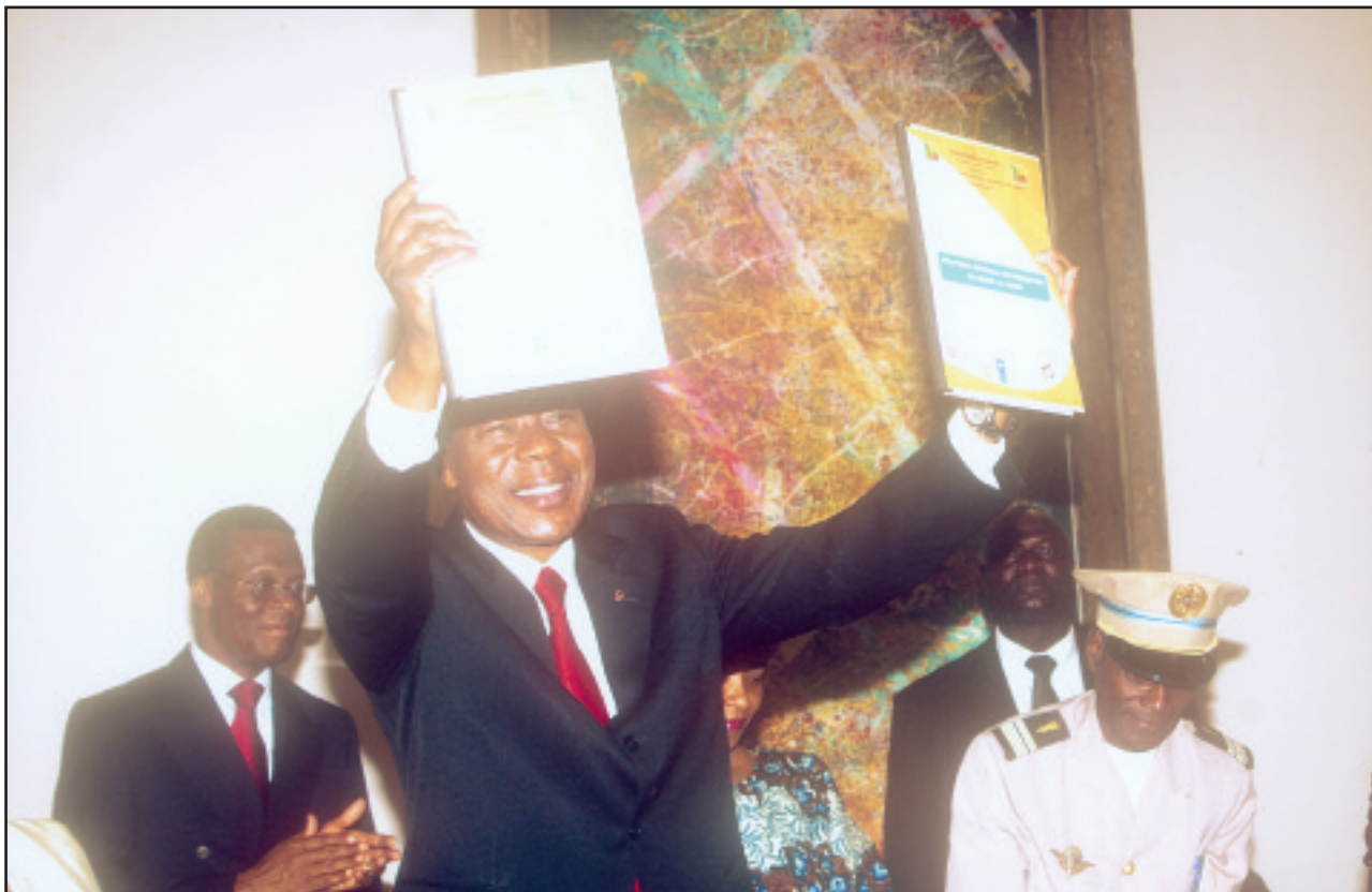
Présentation du document de Politique Nationale de Promotion du Genre par Son Excellence le Président de la République, Chef de l'Etat, Chef du Gouvernement à l'assistance au Palais de la République le 09 mars 2009