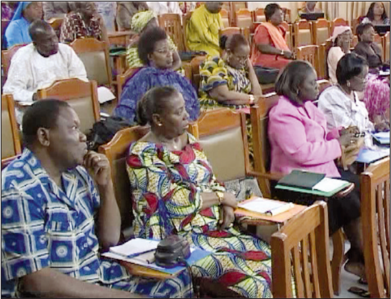
Vue des participants à un atelier national d'élaboration de la Politique Nationale de Promotion du Genre