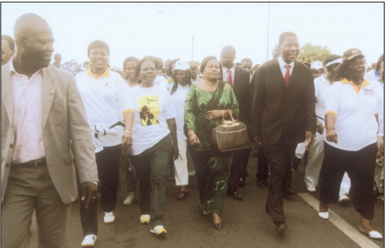
Lors de la caravane du 08 mars 2009, organisée dans le cadre de la célébration de la Journée Internationale de la Femme, toutes les catégories socio-professionnelles se sont mobilisées autour du Chef de l'Etat et du Ministre de la Famille et de la Solidarité Nationale

Le maintien de l'environnement politique national et international favorable à la promotion du genre, l'adhésion réelle et effective des différents acteurs aux engagements de promotion du genre, ainsi que la mobilisation et la sécurisation des ressources financières suffisantes, constituent les conditions préalables nécessaires pour la mise en œuvre de cette Politique.