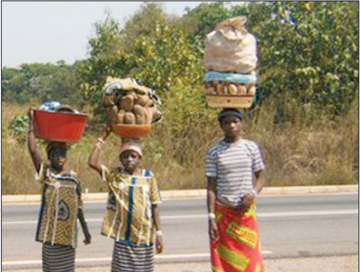
La femme rurale, ouvrière et reine de la ruche humaine