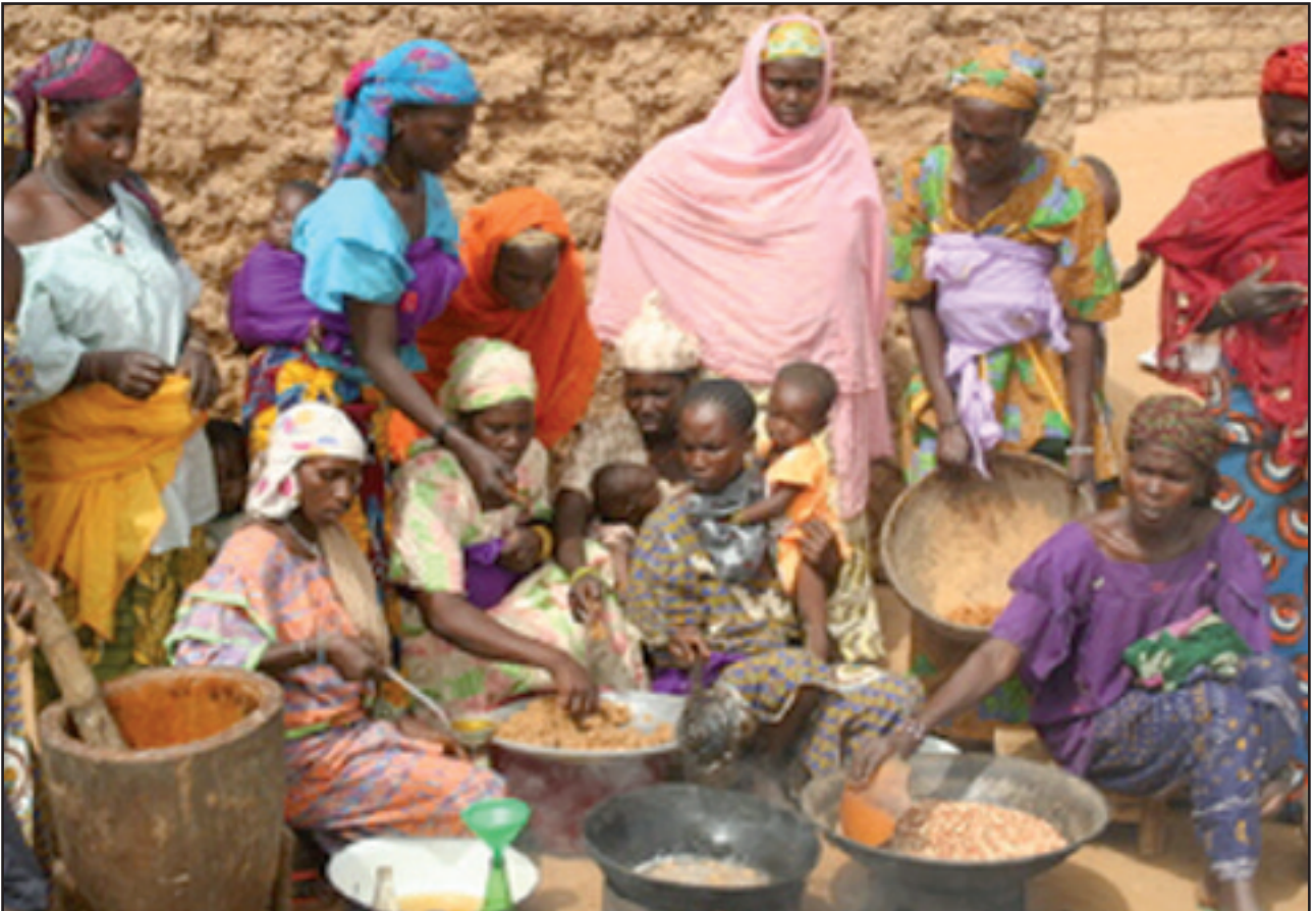
Groupement de femmes rurales au travail