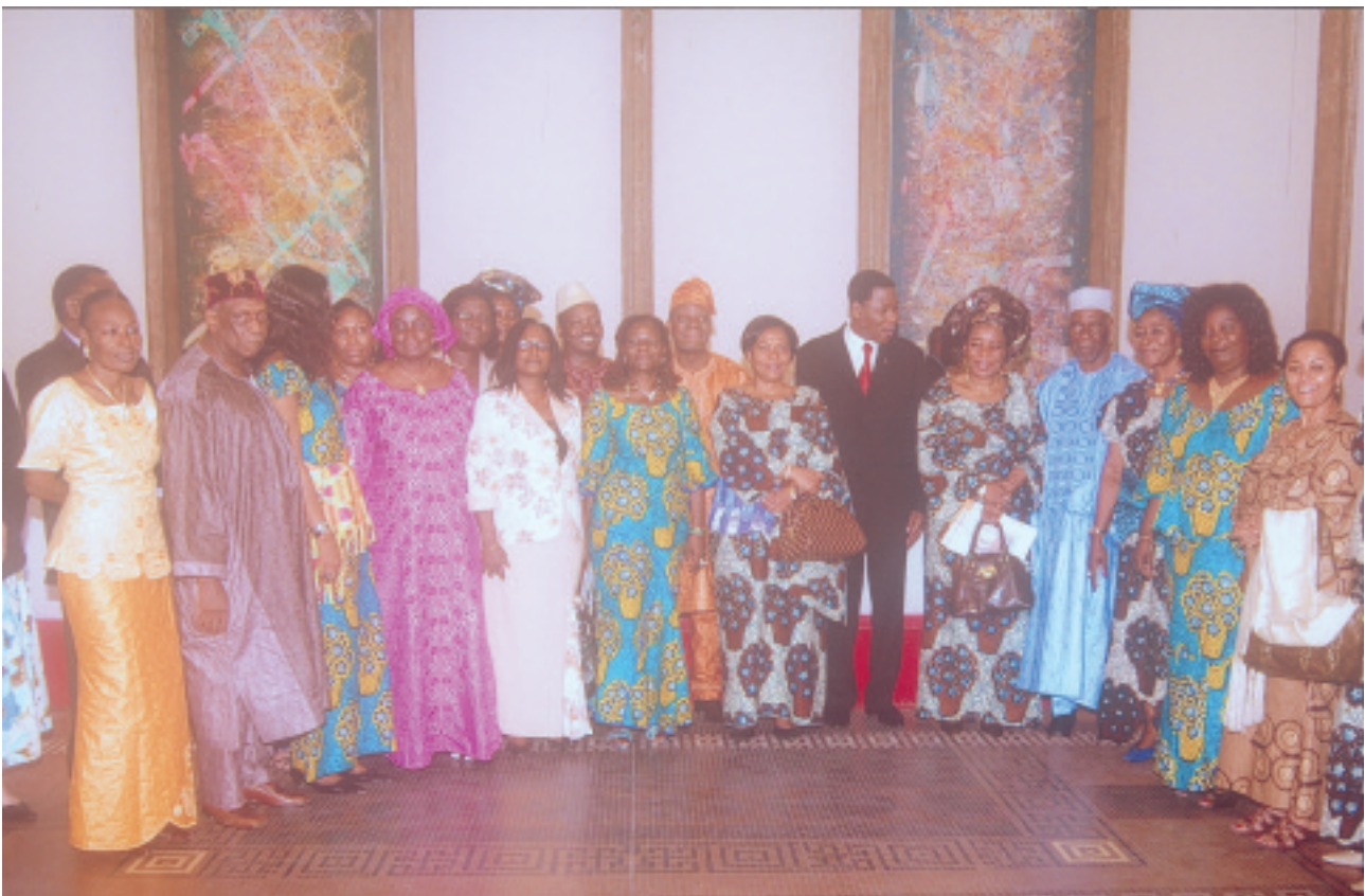
Photo de famille du Chef de l'Etat avec les membres de la Commission Nationale de mise en place de l'Institut de la Femme installée le 09 mars 2009 au Palais de la République

L'ensemble de ces résultats et indicateurs, en liaison adéquate avec les objectifs stratégiques, constitue le cadre logique de la Politique Nationale de Promotion du Genre au Bénin. Le tableau II ci-après donne les détails de la logique d'intervention.