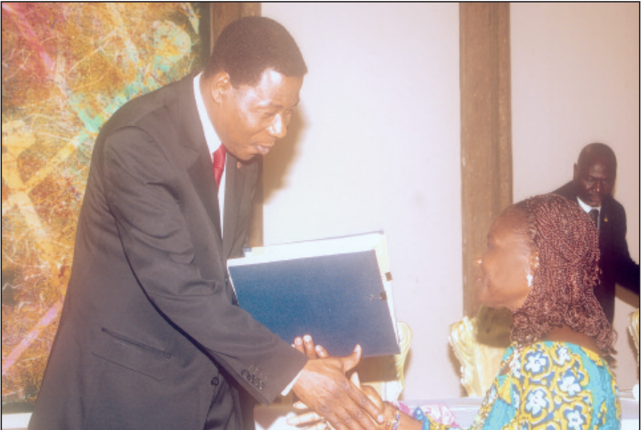
Remise du document de Politique Nationale de Promotion du Genre au Chef de l'Etat par le Ministre de la Famille et de la Solidarité Nationale le 09 mars 2009 au Palais de la République