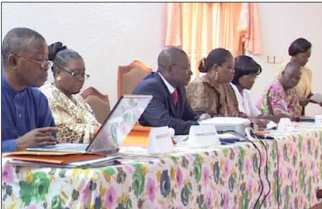
Les parties prenantes à un atelier national d'élaboration de la Politique Nationale de Promotion du Genre

Enfin, l'élaboration de la PNPG a été soutenue aux plans technique et financier par la Coopération Danoise, la Coopération Suisse, le Programme des Nations Unies pour le Développement et le Fonds des Nations Unies pour la Population.